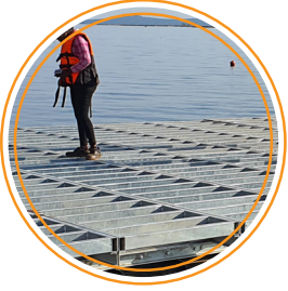
GALVANİZ KAPLAMA ÇELİK KARKAS